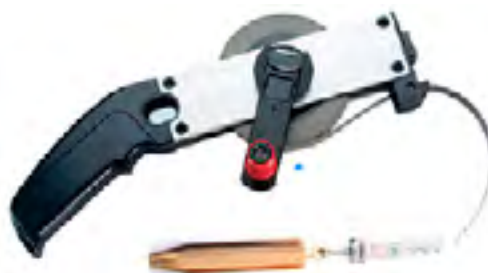
แบบละเอียด